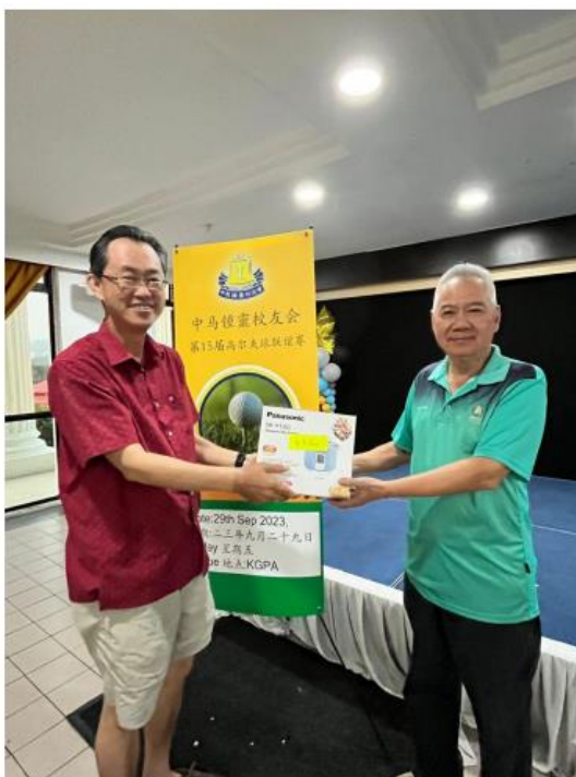
Nearest to Line