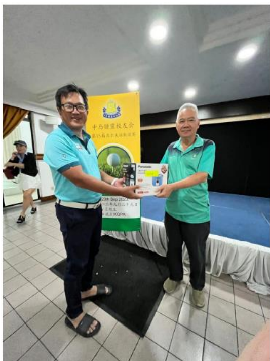
Nearest to Pin